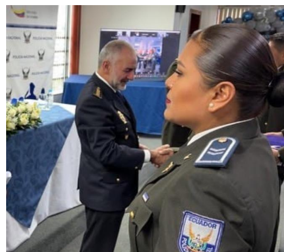
Fotografía 5: Plan de carrera Elaborado por: Policía Nacional