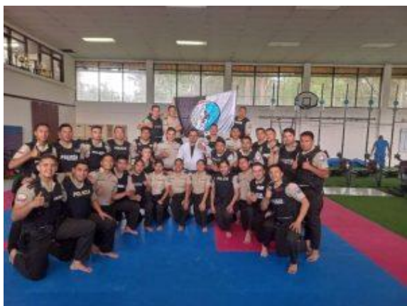
Fotografía 1: Capacitación PCIC