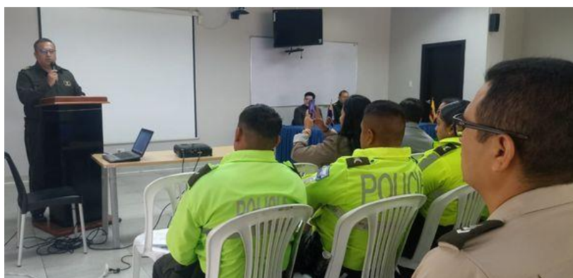
Fotografía 7: Capacitación sobre Integridad y Lucha contra la Corrupción.