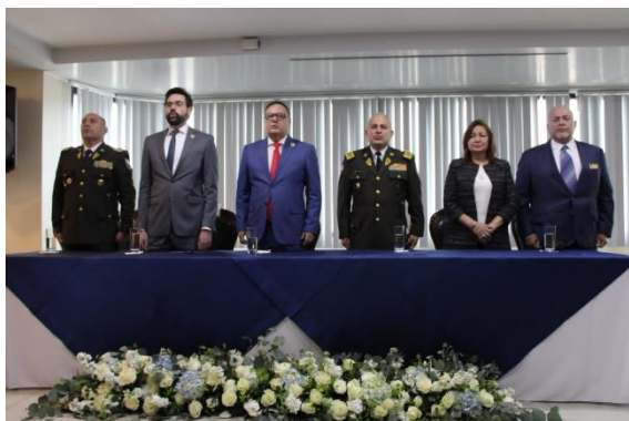
Fotografía 7: Lanzamiento del Plan de Transparencia, Integridad Institucional y Confianza Ciudadana.