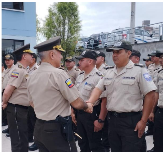
Fotografía 4: Plan de retorno y rotación del Personal. Elaborado por: Policía Nacional