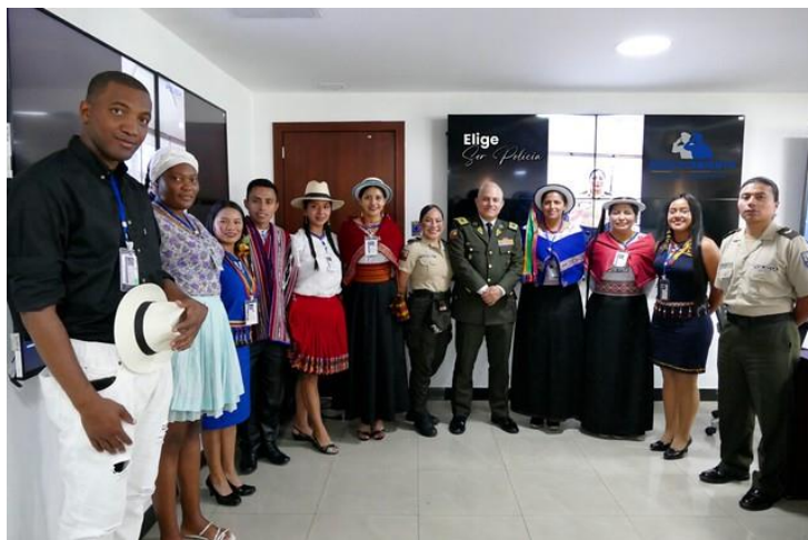
Fotografía 3: Lanzamiento del “Proceso de reclutamiento para selección e ingreso de policías junio2023” dirigido a hombres, mujeres, pueblos y nacionalidades indígenas. Elaborado por: Policía Nacional