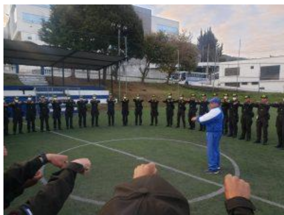
Fotografía 2: Capacitación PCIC defensa personal Elaborado por: Policía Nacional