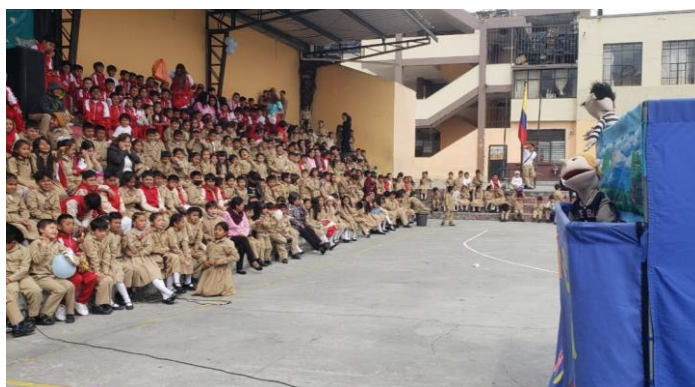
Fotografía 7: Charla sobre cuidado ambiental a Unidades Educativas