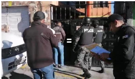
Fotografía 8: Operativo Cero Tolerancia