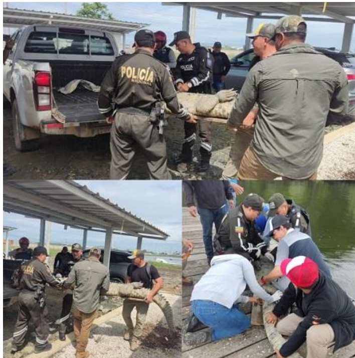
Fotografía 6: Policía rescata cocodrilo y lo devuelve a su hábitat.